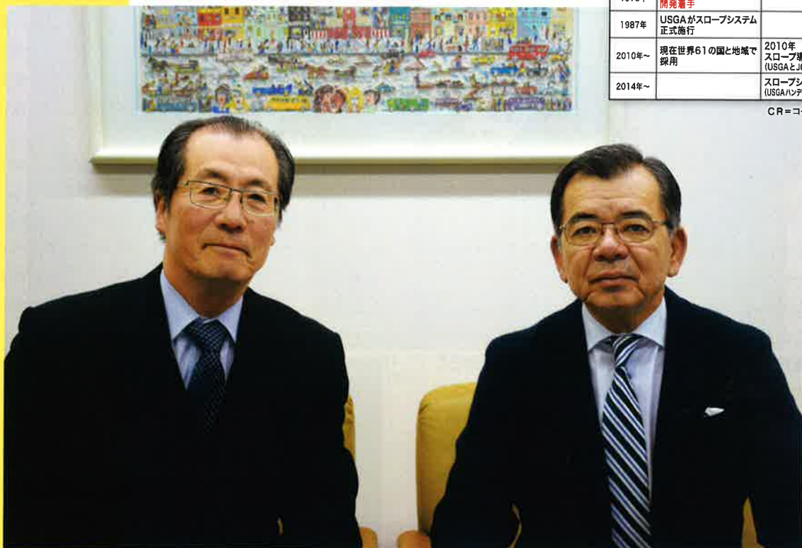
スロープシステムの導入について語る中谷社長(左)と緒方競技委員長(右)