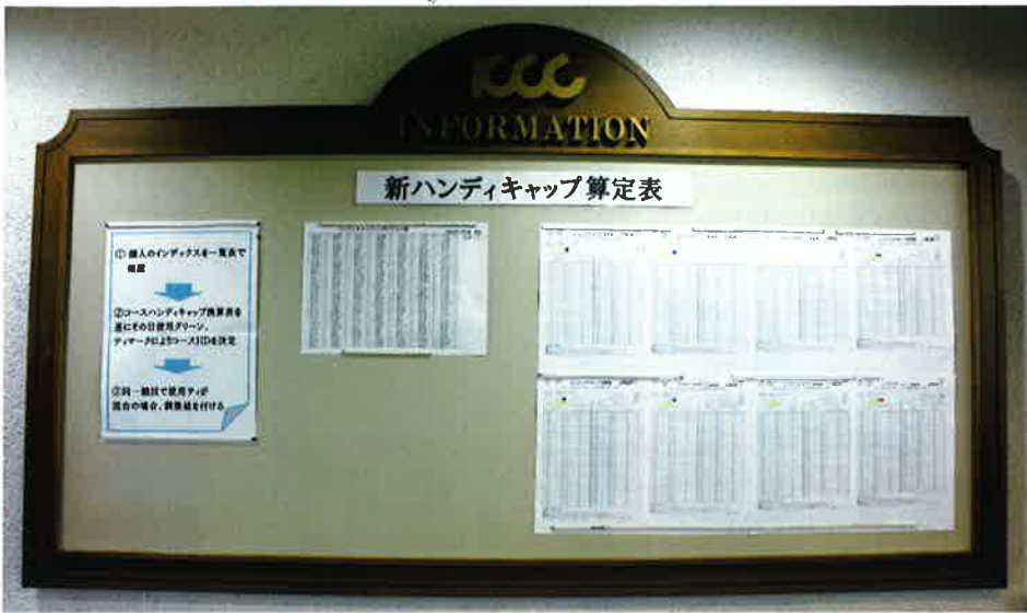
賀茂CCクラブハウス内に掲示されているJGA発行のコースハンディキャップ換算表。スロープシステムなら大人数の男女混合競技で、しかも男女が別々のティールからプレーした場合でもそれぞれのプレーヤーに適正なHDCPを用いることができる。